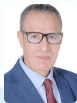
Pr. Bouchta ELMOUMNI Président de l'Université Abdelmalek Essaâdi